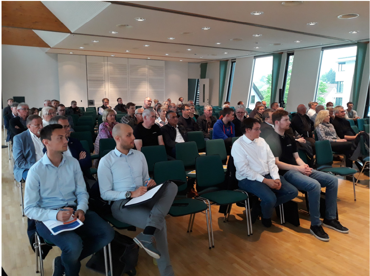
Reges Interesse an den umfassenden Informationen über den Breitbandausbau

Die Information erfolgte im Rahmen eines Informationstermins für Gewerbetreibende (Montag, 20.05.2019 um 14.00 Uhr) sowie zweier Informationsabende für Privatkunden (Montag, 20.05.2019 sowie Donnerstag, 23.05.2019 jeweils um 19.00 Uhr). Die größten Gewerbekunden wurden in Einzelgesprächen individuell informiert.